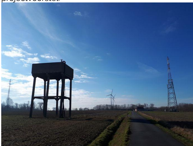
De huidige staat van de vlastoren aan de Klare Gracht in Izegem.

"Het projectvoorstel om de watertoren om te bouwen tot een uitkijkpunt en een geïntegreerd kunstproject kreeg veel bijval bij Izegemnaars en er kwamen ook veel positieve reacties van buiten de regio", zegt schepen van Cultuur en Erfgoed Kurt Himpe (N-VA). "We zagen met het prachtige projectvoorstel dat uitgewerkt werd door kunstenaar Elias Cafmeyer een mooie combinatie van erfgoed, kunst en beleving en een meerwaarde voor het nabijgelegen provinciaal domein Wallemote-Wolvenhof. Alle ingediende projectvoorstellen werden beoordeeld en de watertoren ligt dus blijkbaar te dicht bij de E403, wat volgens ons net een meerwaarde zou zijn. Westtoer oordeelt ook dat er te veel kunst verwerkt werd in het projectvoorstel."